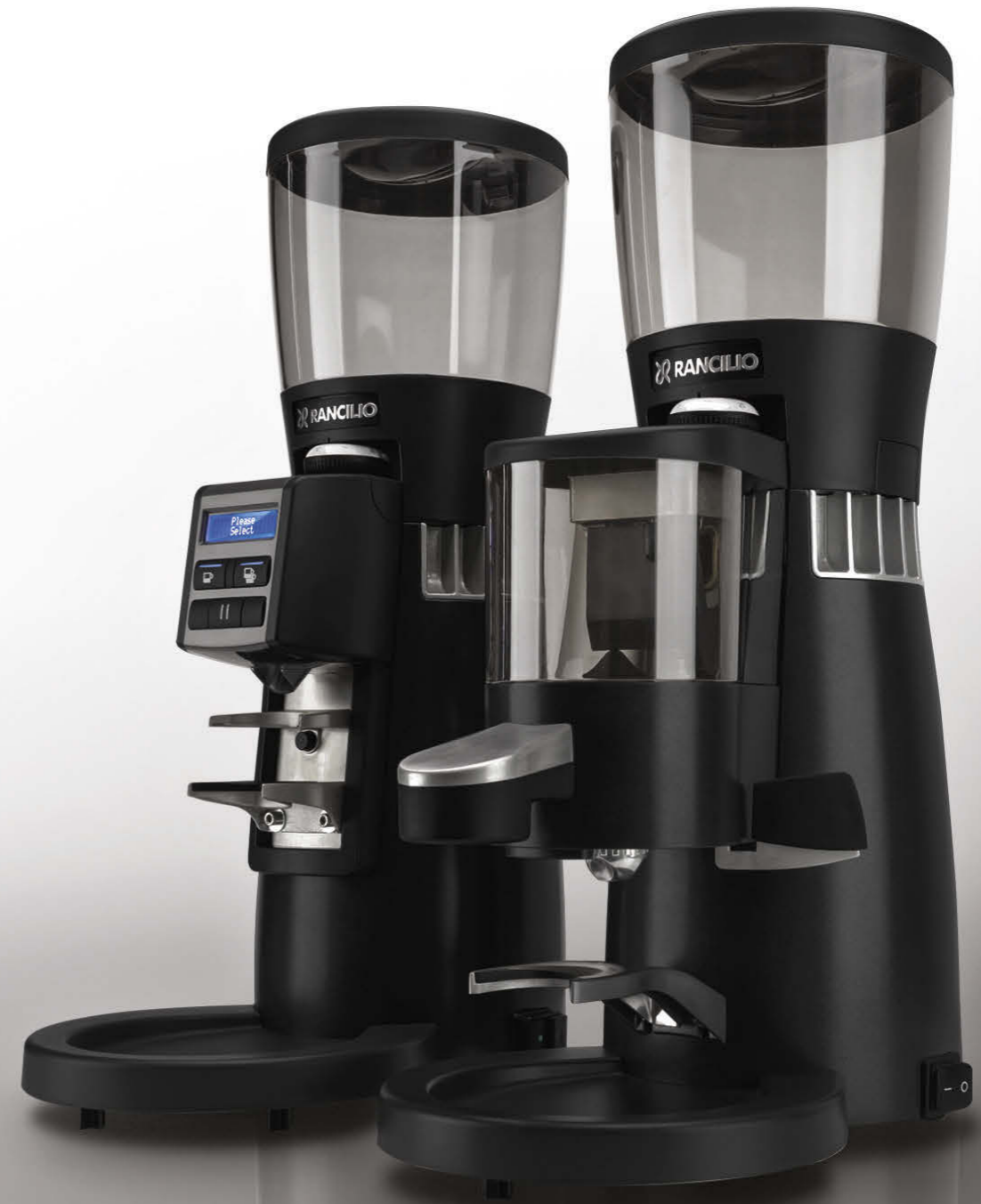
KRYO 65 OD / 65